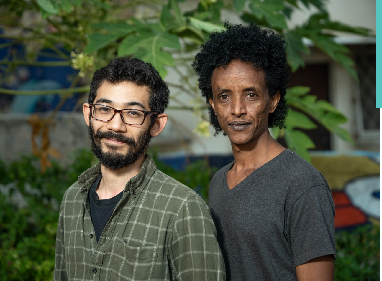
ארגון אל"ף - קיי אישי ואפורקי

אל"ף היא עמותה אחת של ARDC אשר פועלת עם קהילות הפליטים האפריקאים בצפון ישראל. אל"ף צמחה מיזמה קהילתית קטנה של מתנדבים, כתגובה למחסור בשירותים לפליטים בצפון הארץ, ושמה לה למטרה לחבר את הפריפריות הללו לרשת הרחבה יותר של שירותים וארגונים לפליטים ברחבי הארץ.